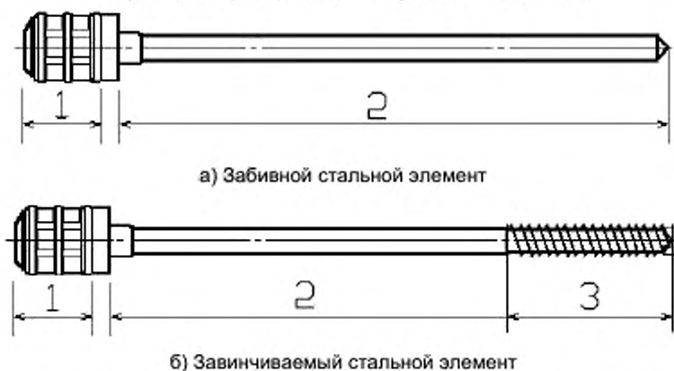
1 — теплоизоляционная головка; 2 — рядовая зона; 3 — резьбовая зона