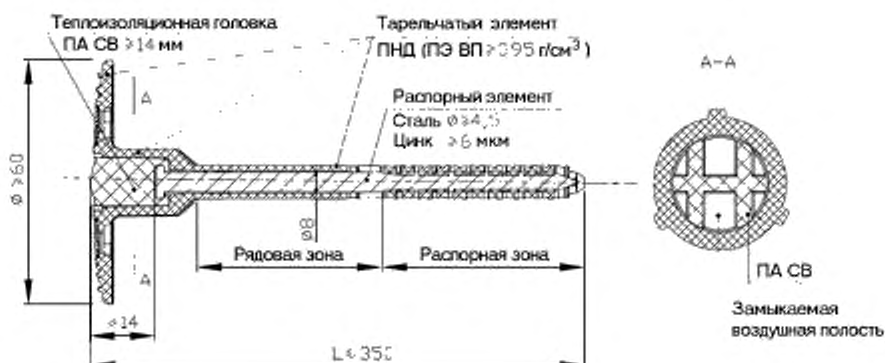
Рисунок 1 — Пример анкера с тарельчатым дюбелем

6.8.3 Допускается применение стального распорного элемента без опрессовки при наличии конструктивно предусмотренной герметизирующей заглушки с воздушной прослойкой высотой не менее 14 мм.